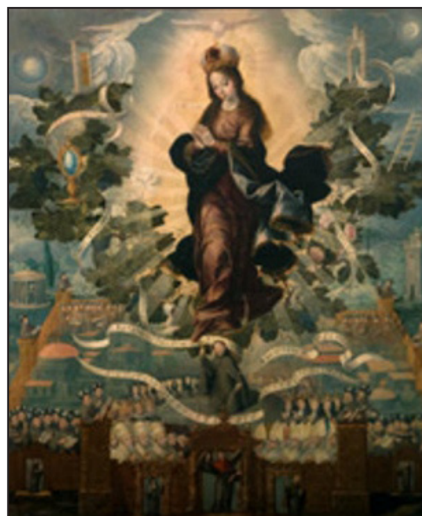
Basilio de Salazar - Mexico, ca. 1624–45 Franciscan Exaltation of the Immaculate Conception, 1637, oil on canvas 47 1/4 x 39 3/4 in. (120 x 101 cm) Museo Regional de Querétaro / INAH