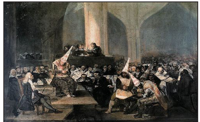
„Suprema” / Consejo de la Suprema I General Inquisition

Нещата обаче не свършват дотук. Салазар не се спира и повежда активна борба за оправдаването на всички обвинени. Развитие на събитията води до Мадрид и до самия център на испанската Инквизиция. Влязъл в остър конфликт с началниците си, Алонсо де Салазар Фриас отнася въпроса до главния инквизитор в Мадрид. Започва продължително заседание на висшият съд на инквизицията, наречен „Suprema” / Consejo de la Suprema I General Inquisition или Съвет на върховната и генерална инквизиция/. Това е доста интересна институция със строги процедурни правила, едно от които е, че говорещия не може да бъде прекъсван по никакъв начин и при никакви обстоятелства. Започва се напрегната борба, в която Салазар хвърля всич-