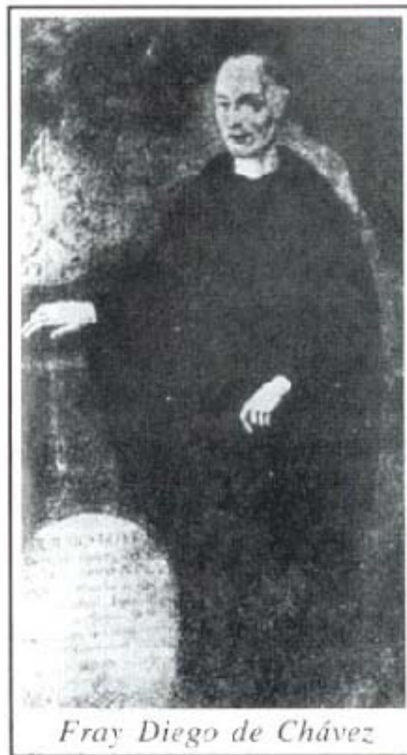
Портрет на Алонсо де Салазар Фриас

* Роден през 1564 г в Бургос, в семейството на адвокати и богати търговци, Алонсо де Салазар Фриас учи каноническо право в Университетите на Саламанка и Сигуенца. След като става католически свещеник, е назначен за главен викарий и за съдия в епископския съд на Каен. Близостта му с архиепископа на Толедо Бернардо де Сандовал Риас, както и големите му способности на юрист улесняват кариерата му и е назначен за главен юрист на църквата в Кастилия през 1600 г и инквизитор на Логроно през 1609 г. Големият му успех в „делото с вещиците“ го прави член на Върховния съвет на Инквизицията през 1631 г. Умира през 1636 г.